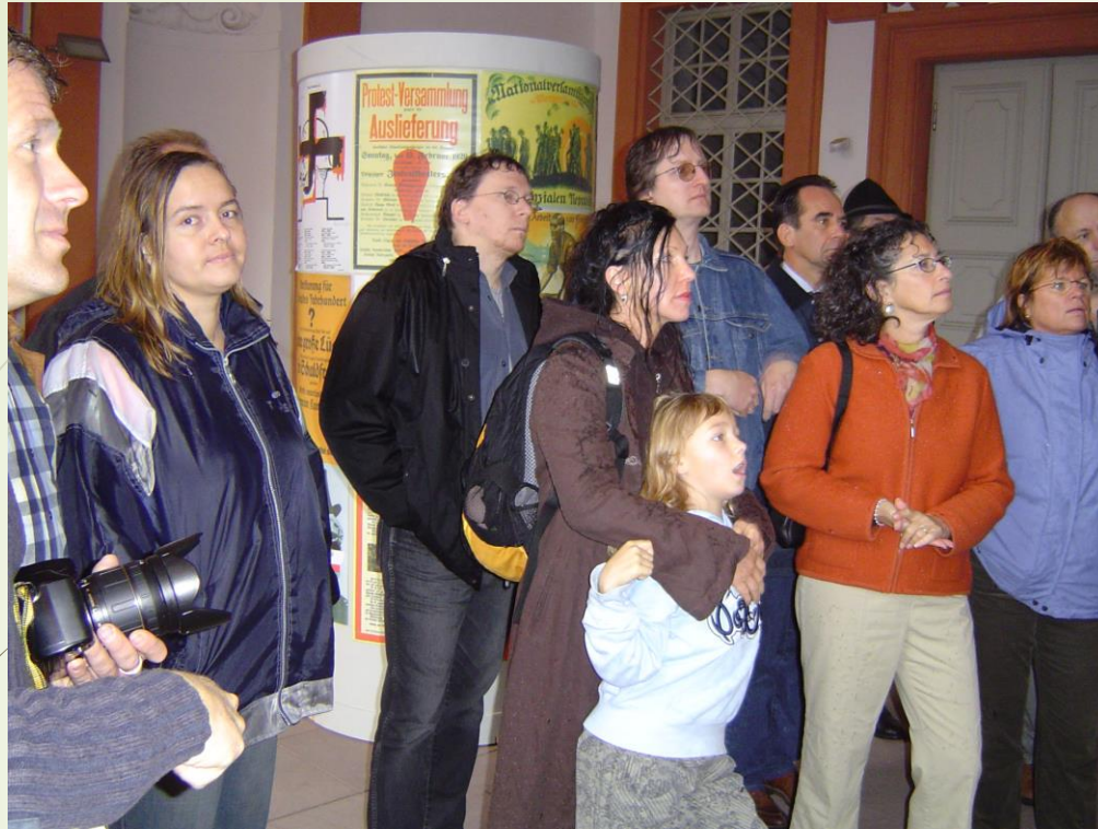
Sailer Artikel Erwachsenenbildung Gehörlose.pdf